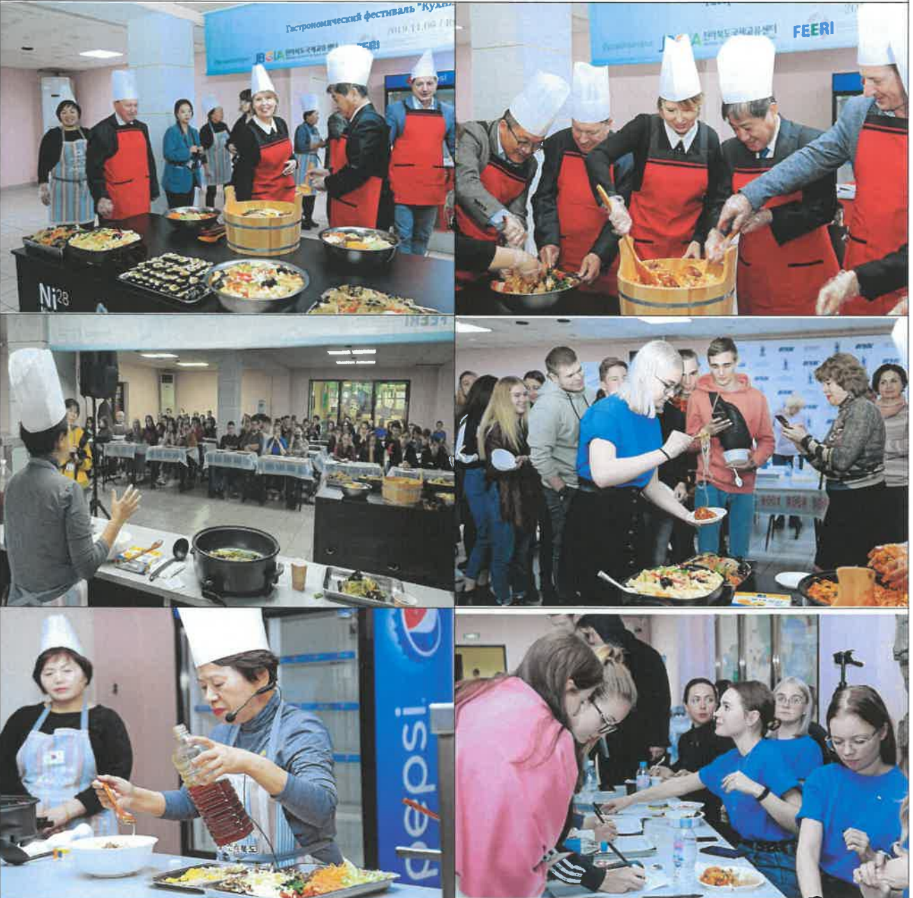
전라북도 음식문화교류 행사 개최