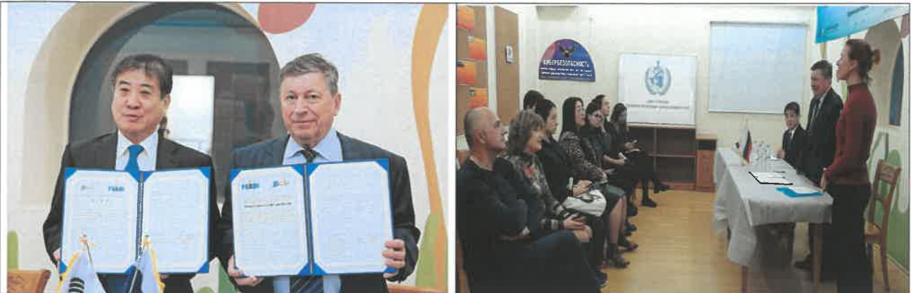
센터-블라디보스톡국립경제서비스대학 극동경제연구소 업무협약체결